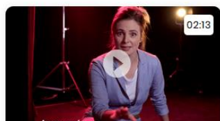
Les petits tutos du Grand oral Je me prépare